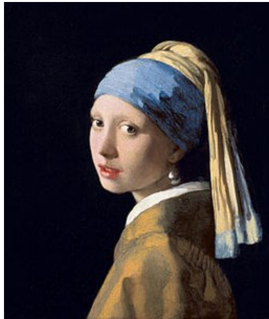
La jeune fille à la perle

On connaît tous ce tableau de Vermeer, « La laitière »! Une marque de yaourts a utilisé ce tableau pour en faire sa publicité!