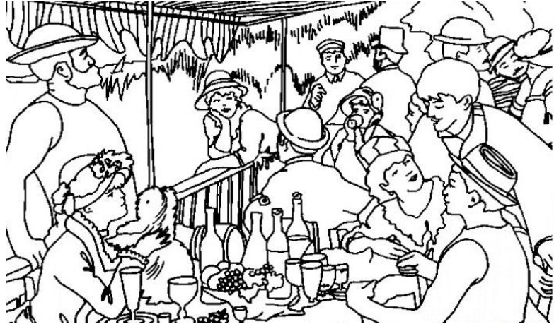
Le déjeuner des canotiers 1880

Pierre Auguste Renoir Né en 1841 Mort en 1919 Nationalité : Française Profession : peintre Mouvement artistique : l'impressionnisme