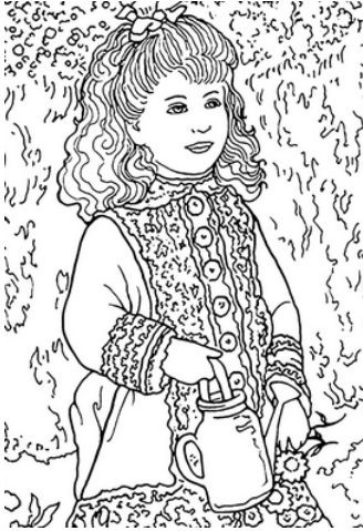
La petite fille à l'arrosoir 1876

L'impressionnisme est un mouvement artistique apparu en France dans les années 1870, dont le nom vient d'une peinture de Claude Monet « Impression, soleil levant ». Les artistes concentrent leur art sur l'expression de la lumière, sur des couleurs claires et lumineuses, sur leurs sensations, leurs impressions. Les impressionnistes peignent en plein air et en toutes saisons ; ils rendent visibles leur touche (manière de poser les couleurs sur la toile) ; ils montrent la vie de leur époque (des Parisiens au bord de l'eau, admirant les trains à vapeur, en train de travailler...)