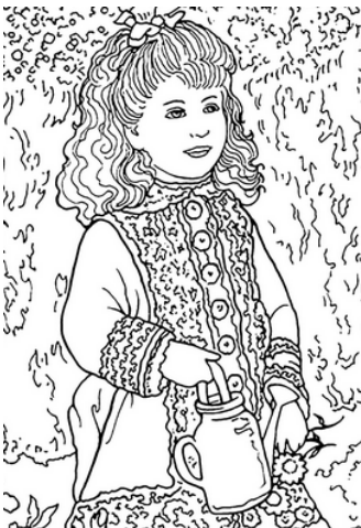
La petite fille à l'arrosoir 1876

L'impressionnisme est un mouvement artistique apparu en France dans les années 1870, dont le nom vient d'une peinture de Claude Monet « Impression, soleil levant ». Les artistes concentrent leur art sur l'expression de la lumière, sur des couleurs claires et lumineuses, sur leurs sensations, leurs impressions. Les impressionnistes peignent en plein air et en toutes saisons ; ils rendent visibles leur touche (manière de poser les couleurs sur la toile) ; ils montrent la vie de leur époque (des Parisiens au bord de l'eau, admirant les trains à vapeur, en train de travailler...)