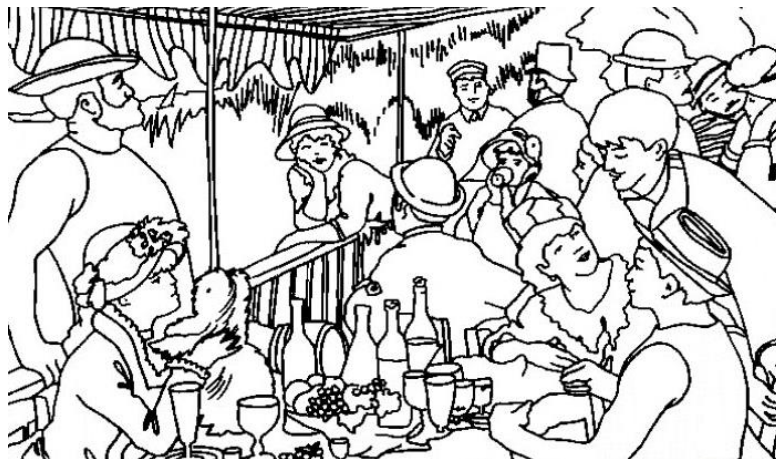
Le déjeuner des canotiers 1880