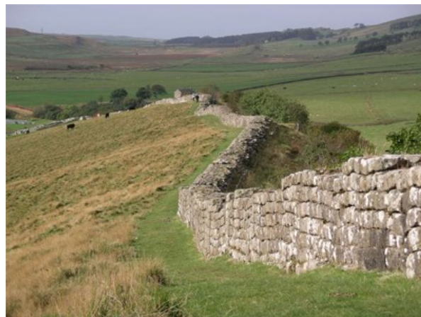
1 - Vestiges du limes: le mur d'Hadrien (Angleterre)