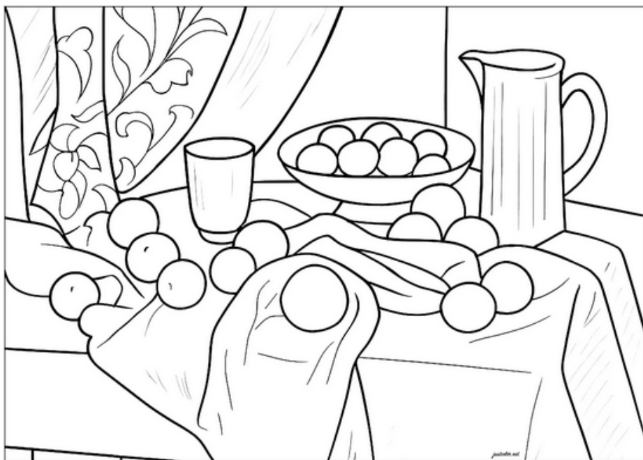
Une nature morte (coloriage inspiré d'un tableau de Cezanne)