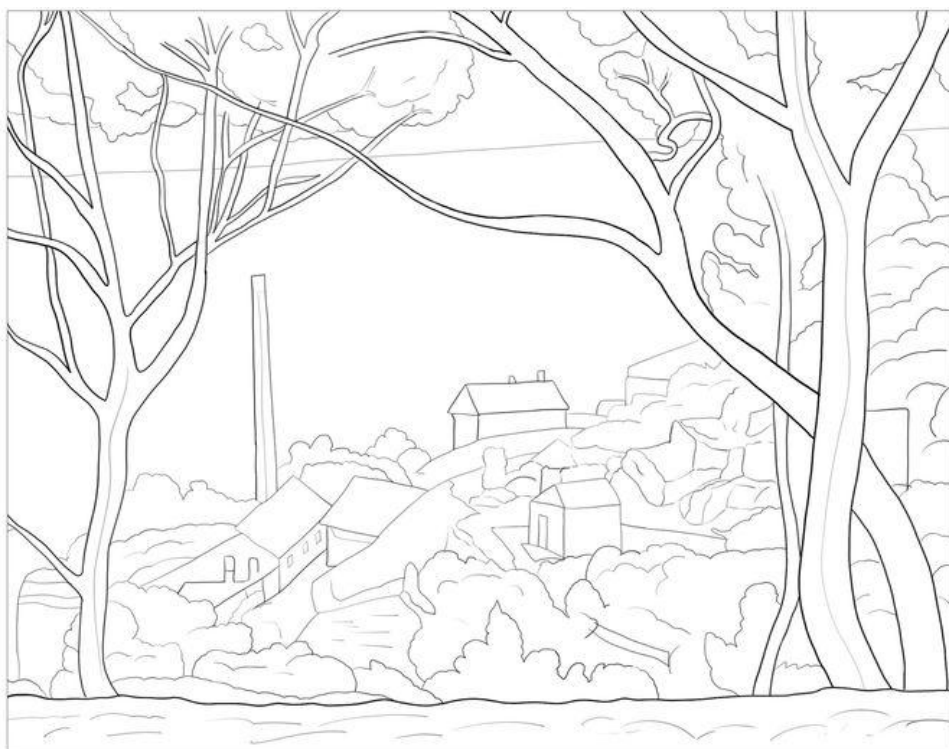
Un paysage (coloriage inspiré d'un tableau de Cezanne)