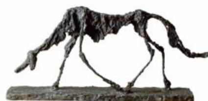
Le chien 1951