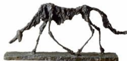
Le chien 1951

Alberto Giacometti Né en 1901 Mort en 1966